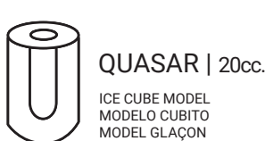
QUASAR | 20cc.

La gamme de machines QUASAR produit un glaçon de forme singulière, qui peut être également retouchée à votre convenance. Le grammage de glace et son volume compensent l'orifice visible sur l'un de ses côtés, pour assurer une productivité maximale.